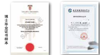
博士学位证书样本