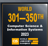
计算机科学与信息系统 301-350