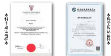
本科学位证书样本