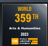
艺术 & 人文 359