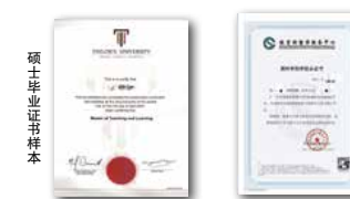
硕士学位证书样本