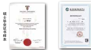
硕士学位证书样本